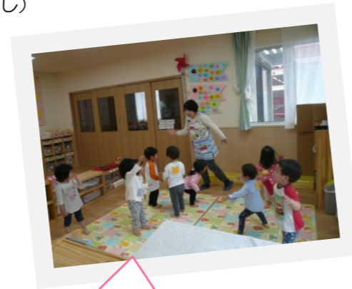
ナチュラル色を基調とした暖かみのある保育施設です♪